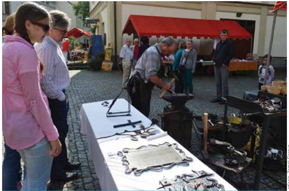
Ponad 40 rzemieślników z Polski, Czech i Słowacji wzięło udział w Cieszyńskim Jarmarku Rzemiosła.