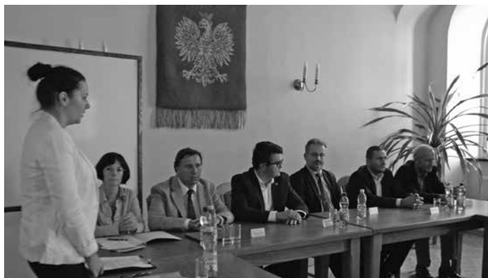
W 2015 r. na torze motocrossowym w Cieszynie-Boguszowicach planuje się zorganizowanie mistrzostw świata.