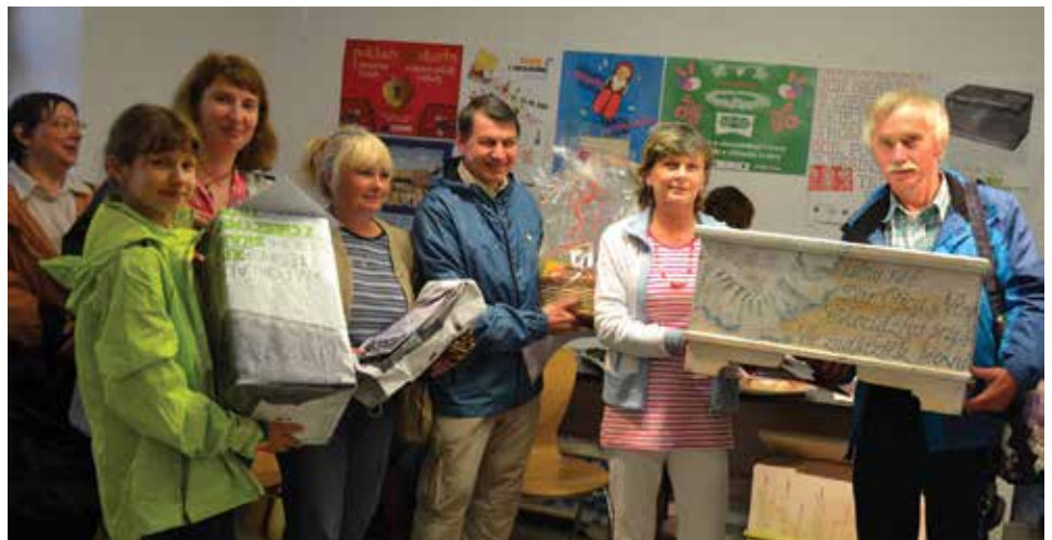
Laureaci Cieszyńskiego konkursu pieczenia strudla im. Kingi Iwanek-Riess.