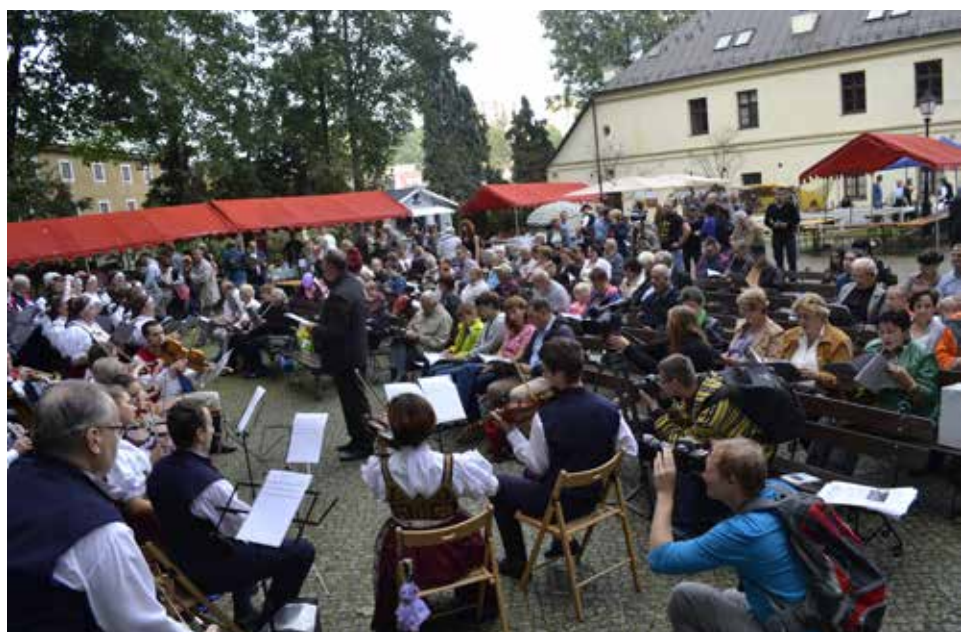
Śpiewanie pieśni legionowych i regionalnych z Chórem Jubileuszowym i kapelą ZPiTzC.